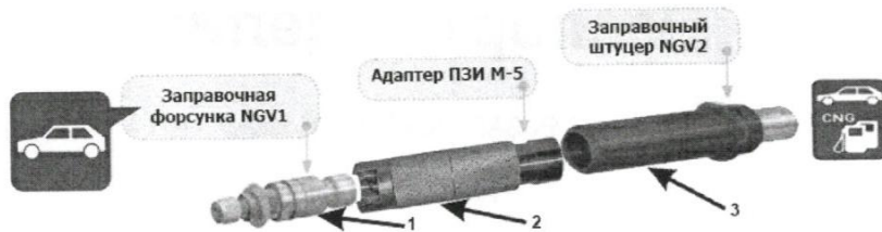
Рисунок 1 – Принцип использования переходника